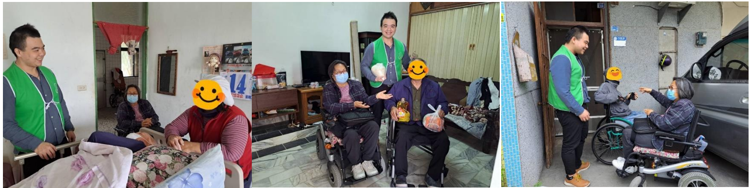
關懷脊傷傷友 與脊髓損傷福利協進會合作，關懷花蓮地區脊髓損傷傷友。