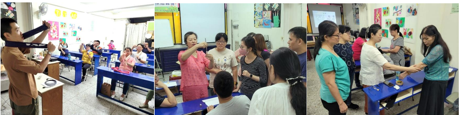
家庭照顧者紓壓講座 透過拉筋、伸展、精油按摩等方式，幫助家庭照顧者紓解工作上累積的疲勞，以及打理家庭時造成的痠痛。