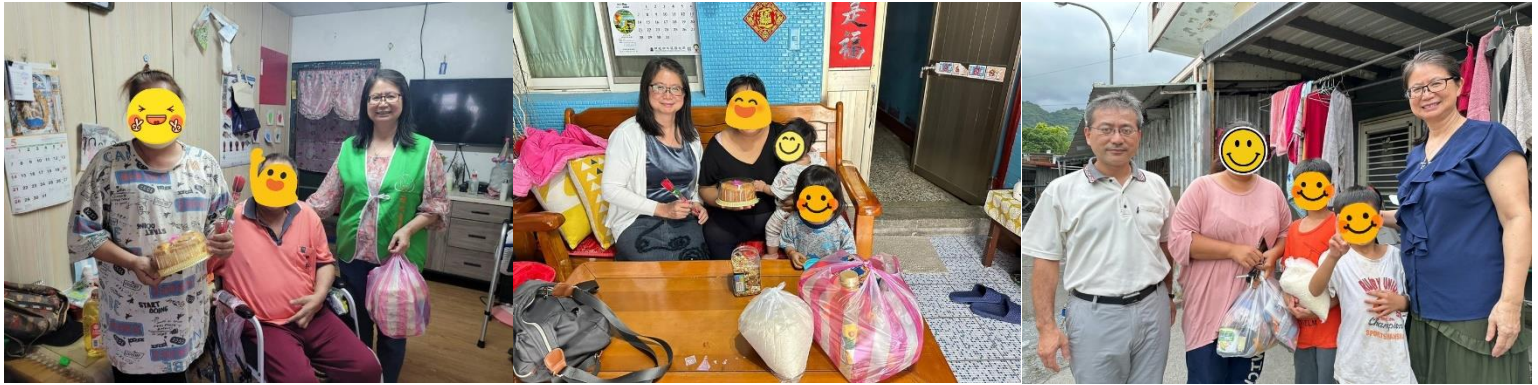
物資發送 募集社會大眾愛心，將各樣生活物資經整理後，發送至需要的家庭手中。