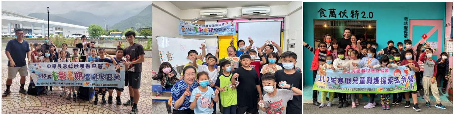
寒暑假兒童營會 為弱勢家庭孩童辦理各種探索、學習、體能等豐富課程之營會。