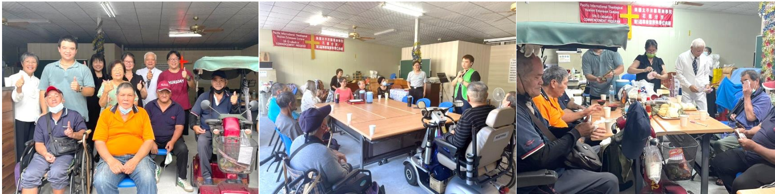
南區服務站 成立南區據點，就近關懷鳳林、萬榮、光復、豐濱等地區弱勢家庭。