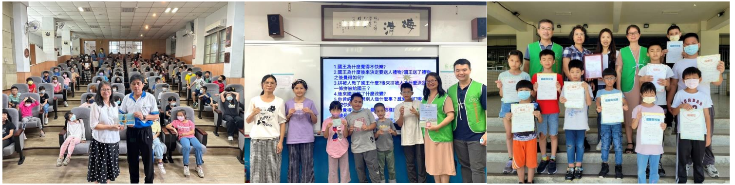
愛心早餐 提供 中華國小 、 太昌國小 、 化仁國小 、 林榮國小 弱勢家庭孩童愛心早餐。