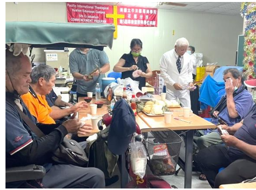
南區服務站 今年2月成立南區辦公室，就近關懷鳳林、萬榮、光復地區之弱勢家庭。