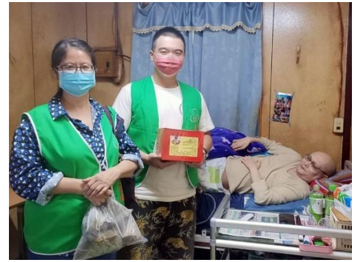
關懷脊傷傷友 與脊髓損傷福利協進會合作，關懷花蓮地區脊髓損傷傷友。