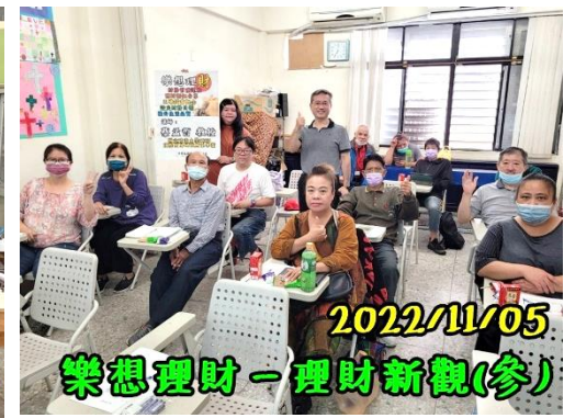
樂想理財系列講座 辦理財務規劃管理講座，邀請平時服務的家庭，給予正確的金錢觀念，在日常生活中能更有智慧去運用。