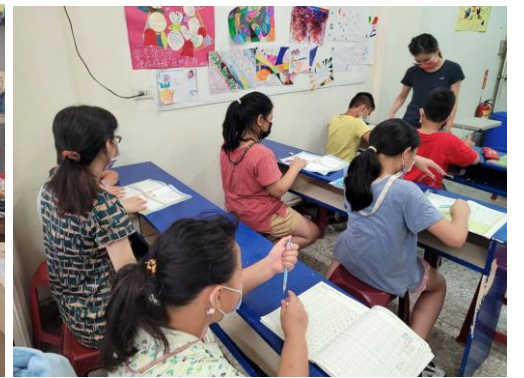
課後輔導班 本會開放教室供弱勢家庭孩童寫作業、閱讀、學習，讓單親家庭或家中沒有家長陪伴之學童，放學後有一個良好的學習環境。