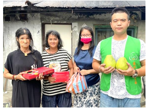
物資發送 募集社會大眾愛心，將各項生活物資經整理後，發送至需要的家庭手中。