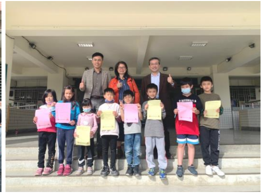
愛心早餐 提供 中華國小 、 太昌國小 、 化仁國小 弱勢家庭孩童愛心早餐。