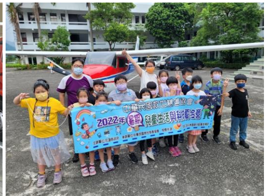
寒暑假兒童營會 為弱勢家庭孩童辦理各種探索、學習、體能等豐富課程之營會。