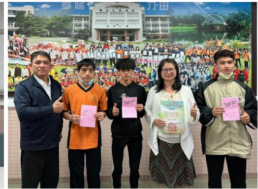
車資補助 補助偏遠地區弱勢家庭國、高中生車資補助。