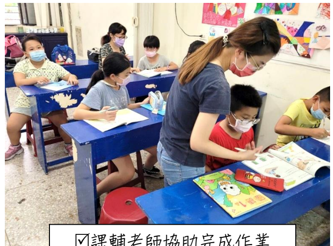
☑課輔老師協助完成作業