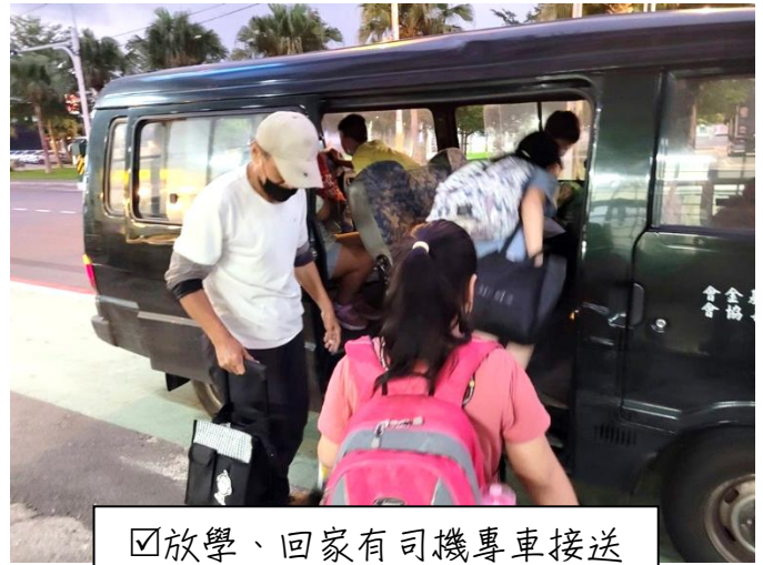
☑放學、回家有司機專車接送

期盼每一位來到我們課後輔導班的孩子們，在這裡得到適切的協助，課業上能有所長進，和朋友們一同學習成長。