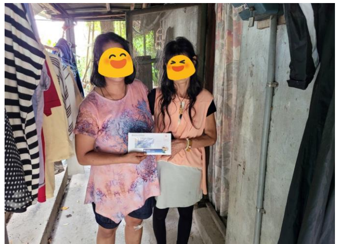
☑ 萬○實業股份有限公司 提供之生活補助金