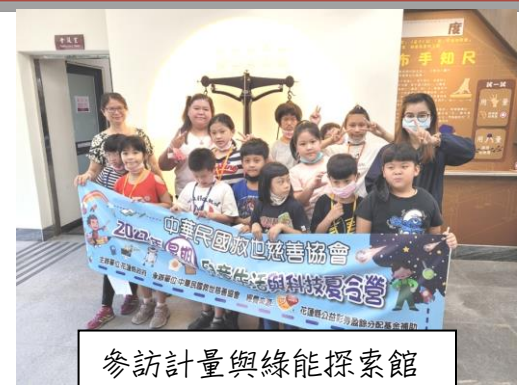
參訪計量與綠能探索館