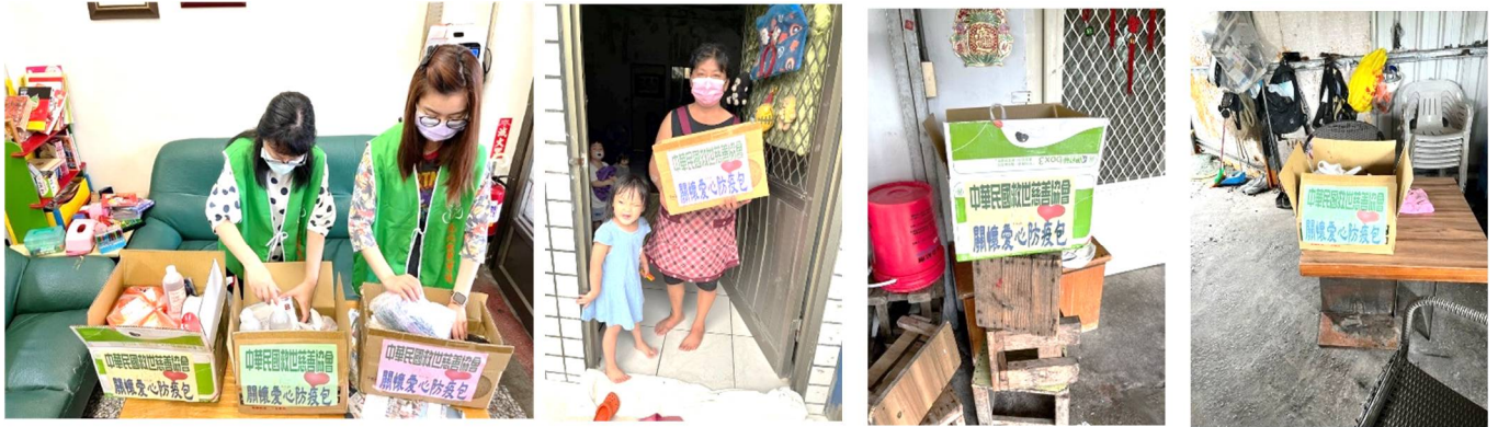
志工將防疫物資整理好並送至案家家中。

疫情期間，協會服務的案家有幾戶不幸確診正在隔離中，協會獲知的第一時間準備防疫物資包，在理事長的帶領下，將愛心與防疫物資親自送到隔離的案家家中。防疫期間我們隔離不隔心，更送上我們的關懷與祝福，希望確診的案家能夠早日恢復健康，也希望大家都能維護好自身的健康，讓我們一起攜手努力對抗病毒，共同度過疫情這個難關。