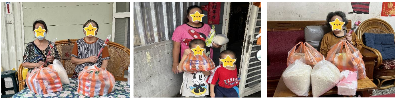
花蓮北區端午節關懷訪視物資發送