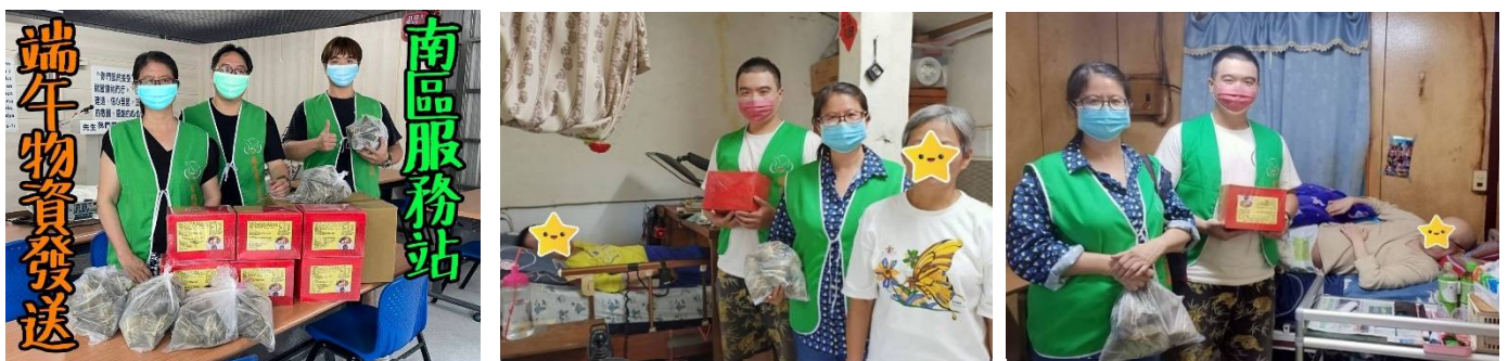
南區服務站端午節關懷訪視物資發送