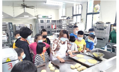
圖為 111 年寒假營隊活動照片