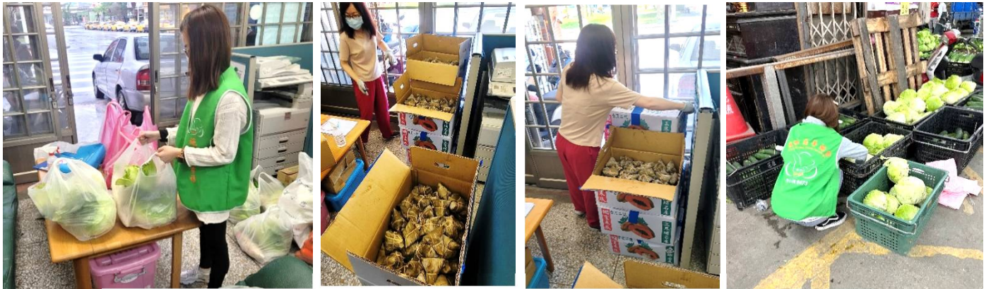
來自社會大眾的愛心透過協會統一整理發送給弱勢家庭

這兩年受到疫情影響，不管是物資及捐款，都比往年少了許多，但是協會關懷訪視及物資發送工作，仍然持續進行著，因協會服務個案中有許多是獨居老人，或是居住在花蓮境內偏遠的部落裡。疫情期間他們需要的是更多關懷與幫助，以及協助他們如何申請政府的補助與方案。雖然疫情讓我們資源短缺，但協會努力讓弱勢家庭得到最妥善的照顧，幫助他們度過這嚴酷的考驗，更希望疫情能夠早日得到控制，讓大家早日回歸正常生活。