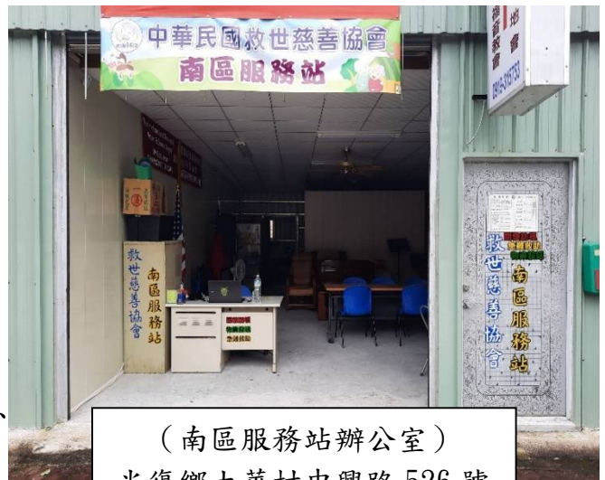
(南區服務站辦公室) 光復鄉大華村中興路 526 號

協會在光復鄉的服務已有些年日，光復鄉占地廣闊，又與市區有些距離，每次下鄉服務只能短暫停留，之後必須返回市區，基於鄉資源較缺，理事長期盼能更多開展在南區的工作，更多深入關懷偏鄉的弱勢家庭。協會於今年開始籌備設立南區關懷站(花蓮縣光復鄉大華村中興路 526 號)。服務對象，除了各村里幹事提供之弱勢家庭，去年更連結脊髓損傷協進會，讓協會有機會服務壽豐、鳳林、萬榮等地區之脊髓損傷之傷友，我們希望能更多服務當地有需要的弱勢家庭。