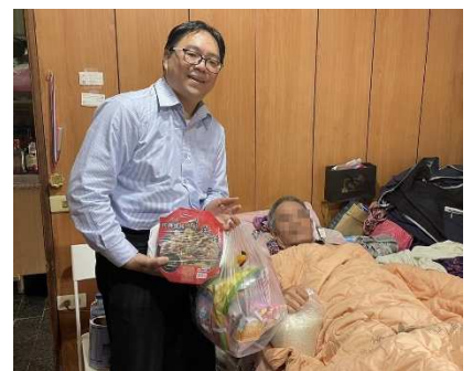
關懷偏鄉，脊髓損傷之友，送上溫暖的幫助。