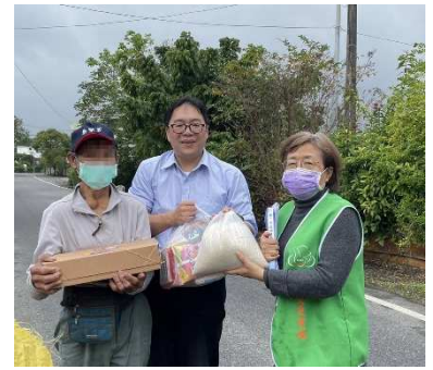
光復、萬榮地區年節關懷物資。