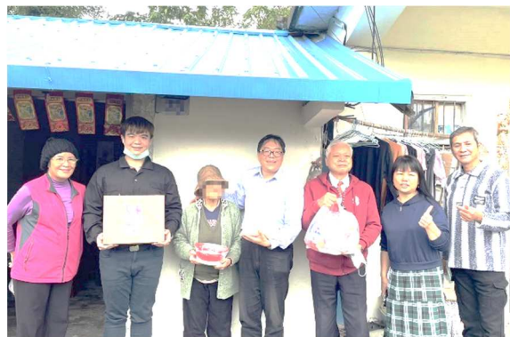
春節關懷訪視及物資發送