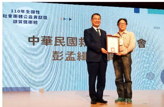
彭理事長(右)於 12 月 1 日參加受贈典禮與內政部徐部長(左)合影。