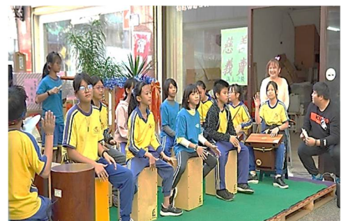
中華國小木箱鼓表演