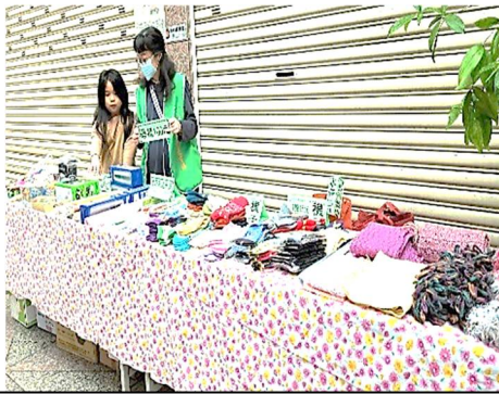
協會志工與孩子們共同擺攤義