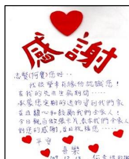
阿珠與孩子們，親手製作感謝卡片，致贈協會與社工。