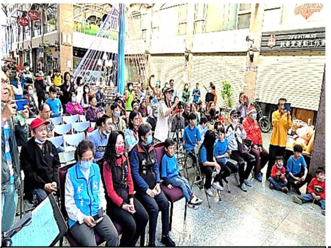
現場來賓及服務案家齊聚一堂

2020“聖誕節”協會邀請服務的弱勢家庭前來參加『聖誕「愛」市集』活動。這次「愛」市集除了一般社會大眾前來參與之外，特別邀請身心障礙的朋友前來擺攤，希望透過愛心義賣活動，讓更多關心在地弱勢族群的朋友一起共襄盛舉，一同來感受聖誕節的喜樂。