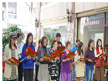
慈恩教會弟兄姊妹詩歌演