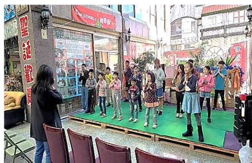
協會課輔班孩童音樂律動

2021 新的一年，慈善協會邀請大家與我們一同推廣更多慈善愛心工作，願每一位弱勢家庭在大家的幫助下，能夠平安喜樂，協會理事長及所有工作同仁，祝大家『身體健康、新年快樂』。