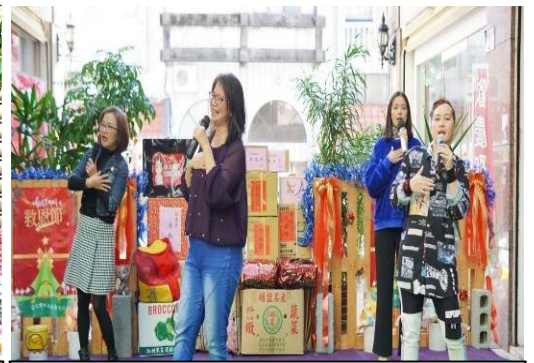
理事長帶領教會姊妹歡唱聖誕詩歌

全球各地受到疫情的影響，讓許多活動都沒辦法舉辦，感謝台灣防疫有成，協會辦理的各項活動還能夠如期進行。活動當日除了聖誕市集，還有精采有趣的表演；慈恩教會演唱詩歌、協會課輔班孩童的音樂演唱、有趣又充滿寓意的話劇表演，特別邀請中華國小的小朋友木箱鼓表演，節目精彩歡樂聲不斷，更有眾所期待的聖誕摸彩。今年的禮物也比以往豐富， 花蓮徐榛蔚縣長 、 魏嘉賢市長 、 傅崑萁立委 、 吳東昇議員 、代表及里長們也提供摸彩品，讓大家都有聖誕禮物。