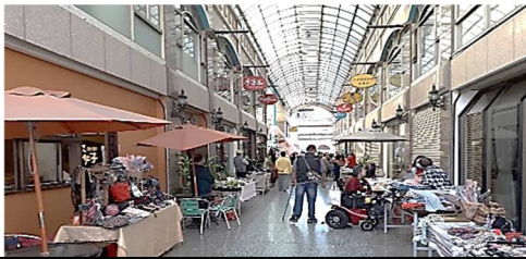
活動當天弱勢身心障礙者，靠自身能力擺攤。

2020“聖誕節”協會邀請服務的弱勢家庭前來參加『聖誕「愛」市集』活動。這次「愛」市集除了一般社會大眾前來參與之外，特別邀請身心障礙的朋友前來擺攤，希望透過愛心義賣活動，讓更多關心在地弱勢族群的朋友一起共襄盛舉，一同來感受聖誕節的喜樂。