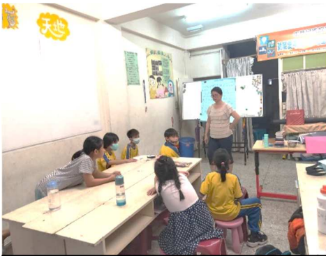
協會定時為弱勢孩童舉辦生命教育

關懷弱勢兒童及青少年，一直都是協會的重要工作項目之一，尤其對弱勢家庭孩童更多陪伴與照顧。因此，常態性辦理「課後照顧班」，讓弱勢家庭孩童在學習上獲得幫助，不因家庭的狀況不好而忽略了學習。有許多的單親弱勢家庭孩童，因為父母親忙於工作，無多餘心力看顧孩子的課業，孩子通常單獨在家無人看管督促，學校作業無法按時完成。