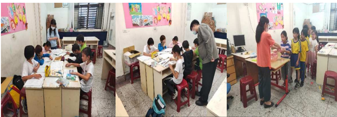
課輔老師協助孩童完成回家功課

協會於暑假期間，舉辦為期五周全天候孩童營隊，特地邀請平常來參加課輔班的小朋友，一方面讓這群孩子在暑假期間能夠有好的去處，也讓弱勢家庭家長們放心把小朋友交給我們，安心工作。此次營隊課程安排有 烏克蘭麗麗、疊杯、桌球、陶藝、益智桌遊、漆彈體驗、生命教育、作業指導、戶外農場體驗 …等，讓這群孩子在暑期能充實自己，留下美好的回憶。