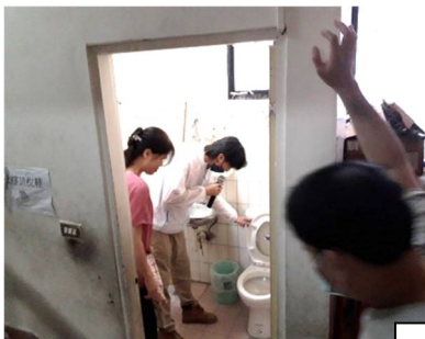
水電課程:馬桶修繕，簡易的故障排除