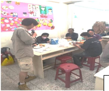
水電課程:基本電的維護及基礎維修