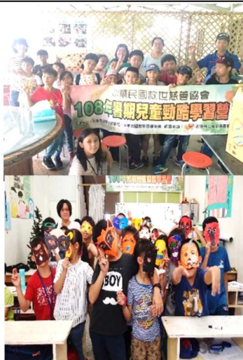
歷年暑期活動照片

因新冠肺炎影響百業蕭條，許多長期支持者因疫情關係也先暫停捐款及捐物。而今年暑期營隊活動經費短缺，每位孩童需 6000 元的營隊費用，希望您一同來支持，讓弱勢家庭孩童可以安全、快樂的學習。