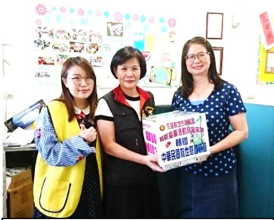
花蓮縣地方稅務局捐贈慈善協會愛心

台灣雖然防疫有成，但疫情所造成的衝擊卻時時刻刻的影響著我們的生活周遭。尤其社福機構募款更加困難，協會這次也受到波及，捐款數縮減約五成左右。或許大家也因這次疫情受到影響，無法捐助款項及物資，但有一種最簡單、最容易做到的善事就是『隨手捐發票』，不論男女老少都可以響應，每張發票都代表著一份愛心、一個希望。