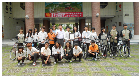
蔡理事長至花蓮高農發送上、下學期車資及腳踏車與同學們合影