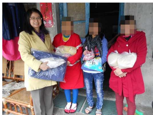
理事長帶領協會同仁發送年節物資