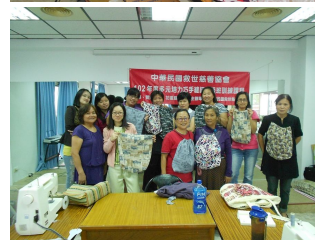
多元培力-巧手縫紉初級班 協會透過發展多元生涯培力計畫，協助單親學員學習專業技能。