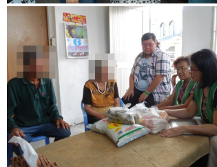
關懷慰問 持續、積極地關懷訪視案家，發放物資、以及急難救助。