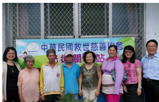
年度回顧，光復關懷站成立