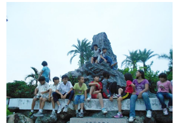
放學後課輔-輔導計畫 長期服務輔導學生課業以低收入戶、單親家庭、隔代教養、困難家庭之國中、國小兒童少年為對象。