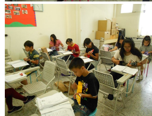
烏克麗麗音樂才藝班 提供弱勢家庭孩子，有學習才藝的機會，還能讓他們穩定情緒、提高孩童自信心。