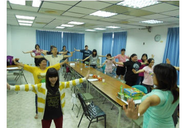
單親家庭-支持成長團體坊 透過半開放式小團體活動，引導親子教養問題，使家長能了解自身與孩子相處互動時的情緒與作為。