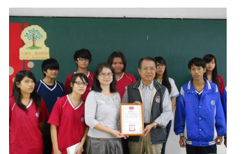
助學金-上下學車資補助 幫助弱勢家庭子女，上下學需搭乘大眾運輸工具學生給予車資補助。