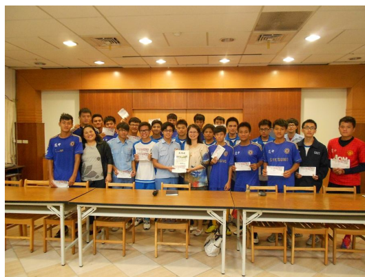
理事長前往各校發送 102 學年度第一學期上、下學車資。