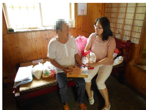
理事長於中秋前夕前往弱勢家庭發送愛心月餅。