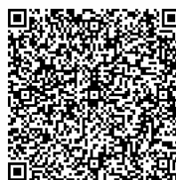
救世慈善協會 QR 碼