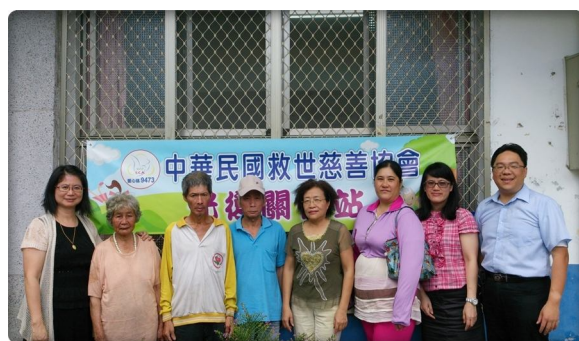
理事長與協會志工、案家合影