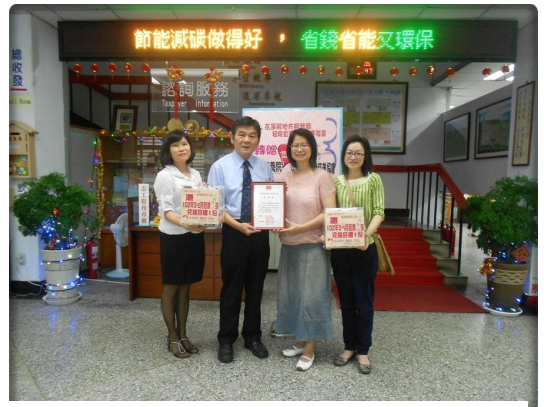
花蓮縣地方稅務局林全祿局長（左二）與協會理事長（右二）合影。

局長林全祿 表示：自統一發票特獎獎金提高為 1,000 萬後，民眾捐贈發票的意願顯著低落。該局在配合 財政部 重要政策「捐發票、送愛心、作公益」活動的同時，除利用各項租稅活動場合，向愛心民眾募集發票外，還能拋磚引玉，發揮對弱勢團體之關懷及提供適時之協助。